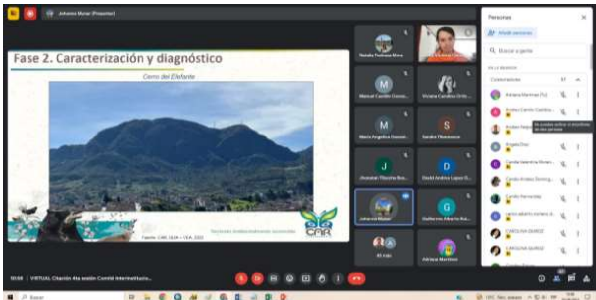
Imagen 2. Captura de pantalla de la reunión, Google Meet. Presentación de la CAR.

La identificación de la oferta paisajística, se basó en información secundaria en donde se identificaron más de 40 montañas entre sierras, cerros, altos, lomas y cuchillas. Se presentaron fotografías de norte a sur, desde Usaquén hasta Usme en donde se puede observar en qué paisaje se asociaron las respuestas de los encuestados: Altos de Serrezuela, Cuchilla El Chuscal, Cerro de San Cristóbal, Cerros tutelares (Monserrate y Guadalupe), Cerro de la Cruz, Cerro del Aguanoso, Cerro del Elefante, Parque Entrenubes, Cerro de la Teta, Subestación Telecom, Cerro Cruz Verde, Cerro Pan de Azúcar, etc.